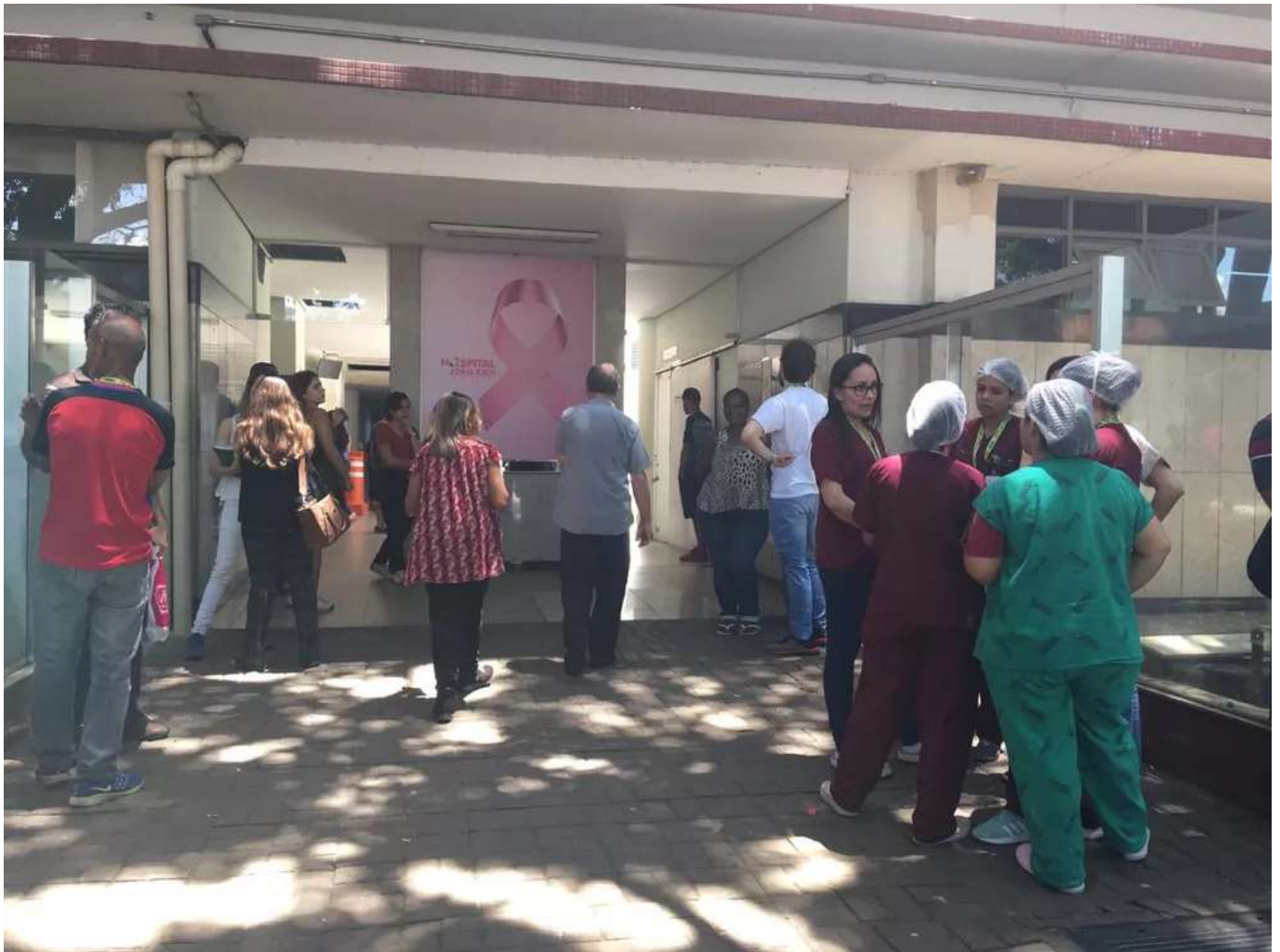
Hospital João XXIII em BH passa por diversos problemas.

20/02/2020 08h53 · Atualizado agora mesmo